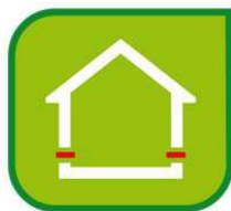
Izolácia proti vlhkosti

Hydroizolačné pásy a fólie. Asfaltované pásy proti vlhkosti vrátane asfaltovaných podkladových pásov proti tlakovej vode. Definície a charakteristiky STN EN 13969/A1:2006.