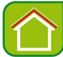
Substrát alebo stredná vrstva