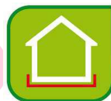
Izolácia proti tlakovej vode