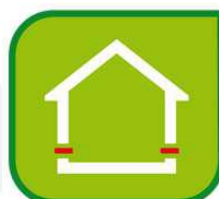
Izolácia proti vlhkosti