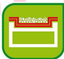
Zaťaženie membrány - viacvrstvový systém