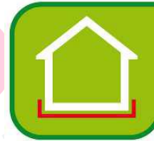
Izolácia spodnej časti budov