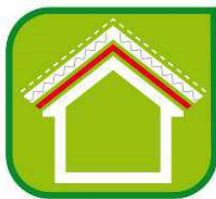
Bariéra proti vode